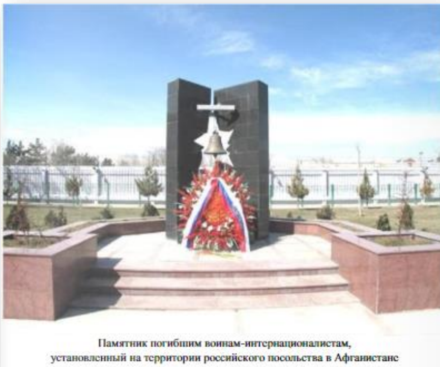
Памятник погибшим воинам-интернационалистам, установленный на территории российского посольства в Афганистане

В Афганистане на территории российского посольства установлен памятник всем погибшим воинам-интернационалистам. В ходе боевых действий на территории Афганистана погибли 14453 советских военнослужащих.